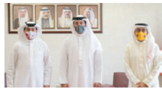
○ رئيس الجمارك خلال لقائه الرئيس السابق لشركة خدمات المطار.

ترأس الدكتور محمد بن مبارك بن دينه الميمون الخاص شؤون المناخ الرئيس التنفيذي للمجلس الأعلى للبيئة الأحيائية الخامسة والثلاثين للجنة التنفيذية للمنظمة الإقليمية لحماية التنوع بالإضافة إلى جمهورية العراق وإيران.