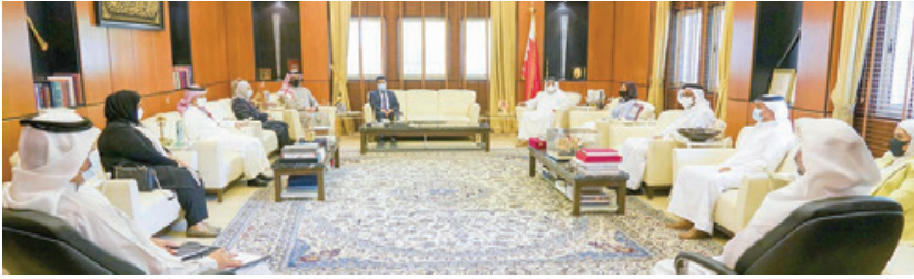
○ وزير الديوان الملكي خلال لقائه مجلس مفوضي مؤسسة حقوق الإنسان.

بتكليف من حضرة صاحب الجلالة الملك حمد بن عيسى آل خليفة ملك مملكة البحرين القديس استقبل الشيخ خالد بن أحمد آل خليفة وزير الديوان الملكي رئيس المؤسسة الوطنية لحقوق الإنسان وأعضاء مجلس المفوضين بالمؤسسة وذلك بمناسبة صدور الأمر الملكي رقم (٢٢) لسنة ٢٠٢١ بتعيين أعضاء مجلس المفوضين بالمؤسسة الوطنية لحقوق الإنسان.