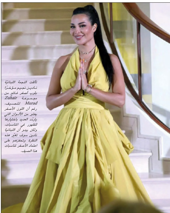
تألقت النجمة اللبنانية نادين نجيم مؤخراً بثوب أصفر فاتح من مجموعة Zuhair Murad للحصيف، رغم أن اللون الأصفر يعتبر من الألوان التي يتردد العديدين باختيارها للظهور في المناسبات، ولكن يبدو أن اللبنانية نادين سوف تتغير هذه النظرة وتحفزهم على اعتماد الأصفر لمناسبات هذا الصيف.

حقق الفيلم من سلسلة المانغا اليابانية الرائجة «قاتل الشياطين: كيميتسو نو يايبا» 40 مليار ين من عائدات شبك التذاكر المحلية التراكمية، ليصبح أول فيلم يصل إلى علامة فارقة بين جميع الأفلام التي تم إصدارها في اليابان على الإطلاق. حقق الفيلم إيرادات بلغت 40.016.94 مليون ين حتى الأحد، وفقاً لما ذكره الموزعون، أمس الأول الإثنين. تجاوز الفيلم حاجز الـ40 مليار ين بعد حوالي سبعة أشهر من عرضه في أكتوبر الماضي، بحسب موقع «اليابان بالعربي». أصبح فيلم «قاتل الشياطين: كيميتسو نو يايبا» الفيلم الأكثر ربحاً في اليابان في أواخر ديسمبر الماضي، متجاوزاً أفضل الرسوم المتحركة Spirited Away «المخطوفة» للمخرج الياباني الشهير هايياو ميازاكي، والذي كسب 31.68 مليار ين منذ إنطلاقه في العام 2001. نجح فيلم «قاتل الشياطين: كيميتسو نو يايبا» أيضاً في الأسواق العالمية، في الشهر الماضي، سجل عائدات افتتاحية قياسية في نهاية الأسبوع لفيلم بلغة أجنبية في أمريكا الشمالية.