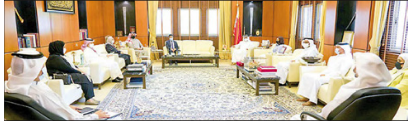
استقبل أعضاء المؤسسة وهنأهم على الثقة الملكية.. وزير الديوان الملكي:

وقد اطلع المجلس التنسيقي برئاسة سمو محافظ المحافظة الجنوبية على عرض مرئي، حول جهود وزارة الصحة في التصدي للجائحة من خلال نشر الوعي واتباع الإجراءات الاحترازية والمتطلبات الوقائية، كما ناقش المجلس