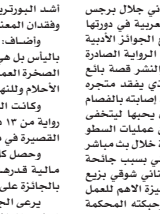
الكاتب الأردني جلال برجس.

فازت رواية «دفاقر السوراق» لأردني جلال برجس أمس بالجائزة العالمية للرواية العربية في دورتها الرابعة عشرة، والتي بدأت من أربع الجوائز الأدبية في مجال الإبداع العربي تتناول الرواية الصادرة عن المؤسسة العربية للدراسات والنشر قصة بائع الكتب والخارج النهم ابراهيم الذي يقعد متجروه ويعد نفسه أسير حياة التشرد وبعد إصابته بالضمام يستدعي أبطال الروايات التي كان يحبها ليتخفى وراء أعتقه وهو يقعد سلسلة من عمليات السطو والسرقة والقتل، جاء إعلان الجائزة خلال بث مباشر عبر الإنترنت لتعذر الحضور الفعلي بسبب جاذحة كورونا، وقال الشاعر والكاتب اللبناني شوقي زريع رئيس لجنة التحكيم، قد تكون العيزة الأهم للعمل الفائز فضلا عن لغته العالية وحيكته المحكمة والمشوقة في قدرته الفائقة على تعرية الواقع الكارثي من ألقته المختلفة، حيث يقعد المؤلف