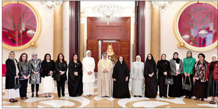
جلالة الملك يستقبل قرينة عاهل البلاد بحضور عضوات المجلس «ارشيفية»