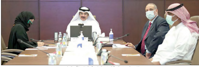
المؤتمر الصحفي للجنة الشؤون الخارجية والدفاع والأمن الوطني

إقرار 14 مشروعاً بقانون في «لجنة الأمن» خلال الدور الثالث