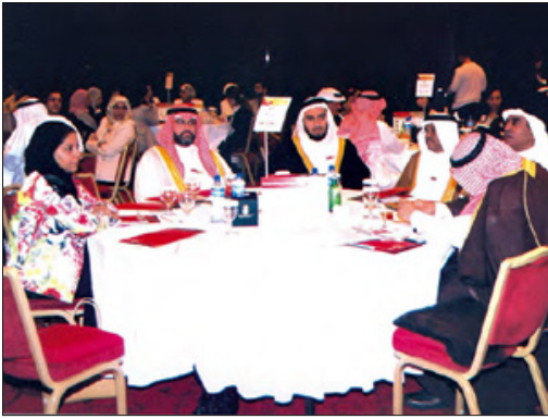
أحد لقاءات تقييم الخطة الوطنية لنهوض المرأة البحرينية