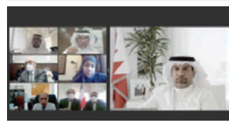
○ رئيس الأعلى للبيئة، خلال اجتماع اللجنة.

بعث حضرة صاحب الجلالة الملك حمد بن عيسى آل خليفة عاهل البلاد القديس برقية تهنئة إلى فخامة السيدة سالوميه زورابيشفيلي رئيسة جمهورية جورجيا، وذلك بمناسبة ذكرى اليوم الوطني لبلادها، أعرب جلالته فيها عن أطيب تمنياته لها بموفق الصحة والسعادة بهذه المناسبة الوطنية.